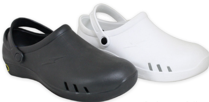
*Estashoe con ventilación

MKT-REV02. Estos datos están basados en información que creemos correcta; son ofrecidas de buena fe pero sin garantía en lo referente a la aplicación y uso del producto, ya que las condiciones y formas de uso se encuentran fuera de control de la empresa. Antes de la utilización definitiva del producto, recomendamos al usuario realizar una evaluación detallada del mismo mediante la aplicación y uso de muestras significativas. Es responsabilidad del usuario verificar la validez de la información expuesta.