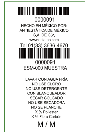
TABLA DE MODELOS

En el caso de la bata una parte de la etiqueta queda encapsulada para que, en caso de romperse la parte exterior, siempre exista un respaldo.